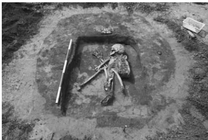
Fig. 15. Svatobořice-Mistřín. A skeleton burial in an Unetice settlement feature.