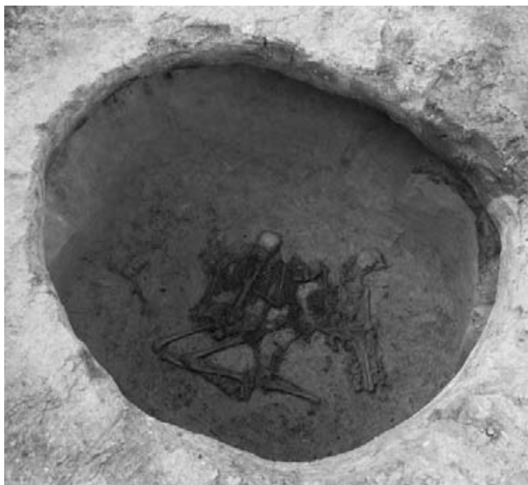
Abb. 9. Podolí. Grab, Aunjetitzer Kultur.

hřebišťe. Zbylé objekty představují především zahloubená síla lichoběžníkového profilu. Neobvyklá situace byla zjištěna v objektu 633 – na dno zásobní jámy byly v souladu s pohřebním rituem uloženy pohřby dvou dospělých a dvou dětí. U obou dospělých jedinců byly v terénu předběžně konstatovány těžké perimortální fraktury lebky. Po částečném zasypání byl do jámy pietně deponován ještě další dospělý jedinec. Pohřební výbava se u všech omezila pouze na jednoduchý osobní bronzový šperk. Pozoruhodné je i uložení dvou kompletních skeletů tura do jiného síla běžných rozměrů (obr. 9).