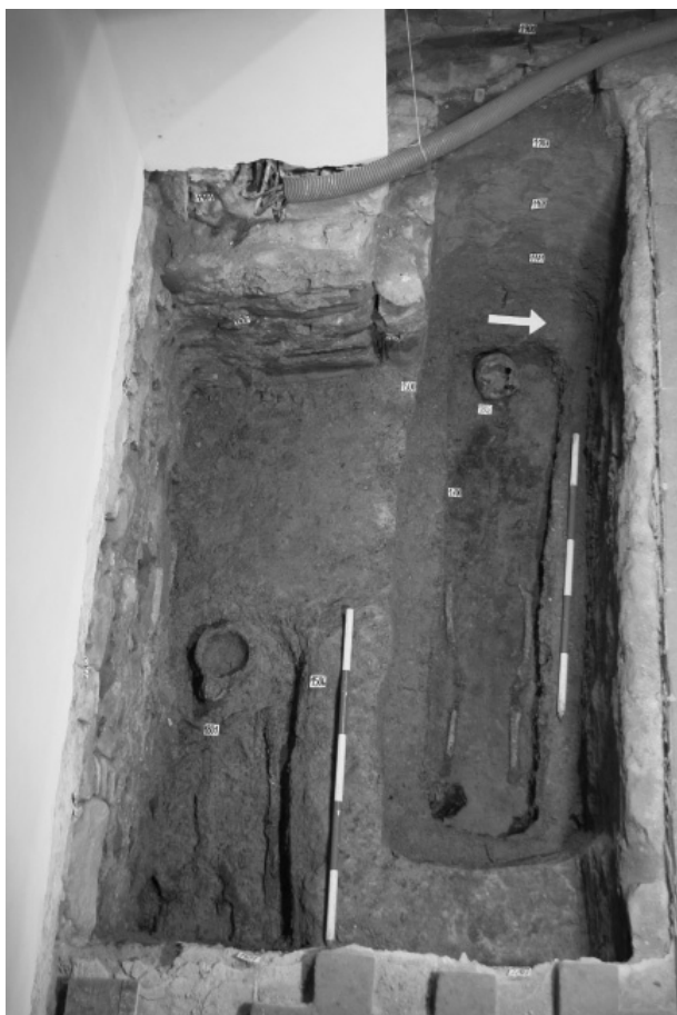
Obr. 62. Kopřivnice, městská část Vlčovice, kostel Všechných svatých. Pohřeb předcházející výstavbě kostela (vlevo) a interiérový pohřeb v jižní části presbytáře u paty vítězného oblouku (vpravo). Sonda S1, pohled od východu. Foto F. Kolář.

Abb. 62. Kopřivnice, Stadtteil Vlčovice, Allerheiligenkirche. Links eine Bestattung vorgängig der Kirchenanbau und rechts eine Kirchenbestattung im Südteil des Presbyteriums am Fuße des Triumphbogens. Grabungsschnitt S1, Blick von Osten. Foto F. Kolář.