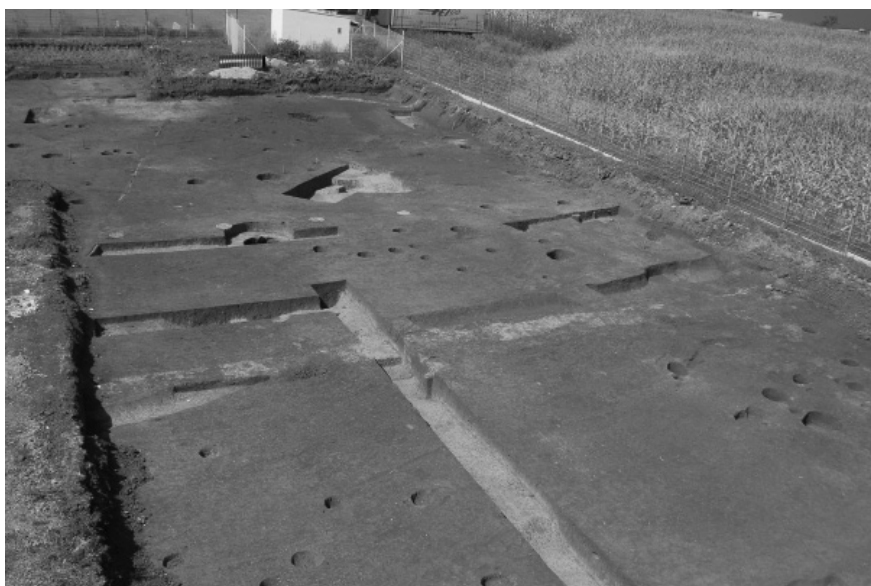
Obr. 63. Kralice na Hané (okr. Prostějov), „Kralický háj“. Severní částí prozkoumané plochy s koncentrací středověkých objektů.

V interiéru presbytáře kostela byly v roce 2012 realizovány tři archeologické sondy (S1–S3, obr. 61). Důležité zjištění představuje zachycení části původního pohřebiště, předcházejícího výstavbě stávajícího kostela. Kostrový pohřeb v natažené poloze na zádech, orientovaný ve směru západ – východ, byl uložen v rakvi (obr. 62). Tento hřbitovní horizont byl následně narušen základovým výkopem pro obvodové zdivo presbytáře. Původní podlaha z cihelných dlaždic byla minimálně jednou obnovena, při stavebních úpravách kostela pak byla nahrazena dlažbou z mramorových dlaždic. Několikanásobné obnově podlahy odpovídají rovněž stavební úpravy oltářní menzy. V průběhu 16.–18. století se v interiéru presbytáře pohřbívalo sporadicky. Na základě nálezů hřebíků a pozůstatků dřeva lze předpokládat, že všechny odkryté pohřby byly uloženy v rakvích. V souvislosti s pohřebními aktivitami v interiéru presbytáře byla cihelná dlažba