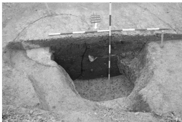
Obr. 64. Kralice na Hané (okr. Prostějov), „Kralický háj“. Superpozice dvou středověkých zásobních jam (obj. č. 530 a 633).

Abb. 64. Kralice na Hané (Bez. Prostějov), „Kralický háj“. Überlagerung zwei mittelalterlichen Speichergruben (Obj. Nr. 530 und 633).