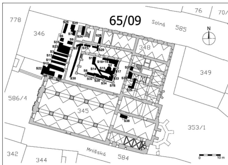
Abb. 96. Opava-Město, dominikanisches Kloster. Grundriss des Klosters mit Bezeichnung der Grabungsfläche.

lenosti cca 4 m od třídy 1. máje dokumentován objekt s konkávním dnem zahluobený do pravěké vrstvy. Objekt byl zachycen v délce 1 m, v hloubce 0,5–1,3 m. Jeho výplň k. 150 obsahovala středohradištní keramiku. Na ulici Dómské byly kromě pravěkého objektu dokumentovány značné úpravy terénu v průběhu 14. století a v novověku.