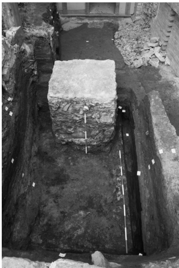
Obr. 99. Opava, ulice Lazebnická. Pohled na plochu výzkumu se zahloubenou částí nadzemní dřevohliněné stavby, včetně dochovaného základového trámového věnce.