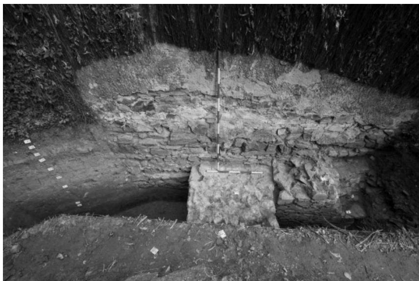
Abb. 101. Opava, Stadtgärten. Unterirdische Relikten der Haupt-Befestigungsmauer mit sekundär gebautem Viereckturm; oberirdisch bestehende Verschanzungsmauer des Minoritenklosters. Grabungsschnitt S18, Blick von Südosten. Foto F. Kolář.

Obr. 101. Opava, městské sady. Podpovrchové relikt hlavní hradební zdi s druhotně přiloženou hradební hranolovou věží; v nadzemní partii stávající ohradní zeď minoritského kláštera. Sonda S18, pohled od jihovýchodu. Foto F. Kolář.