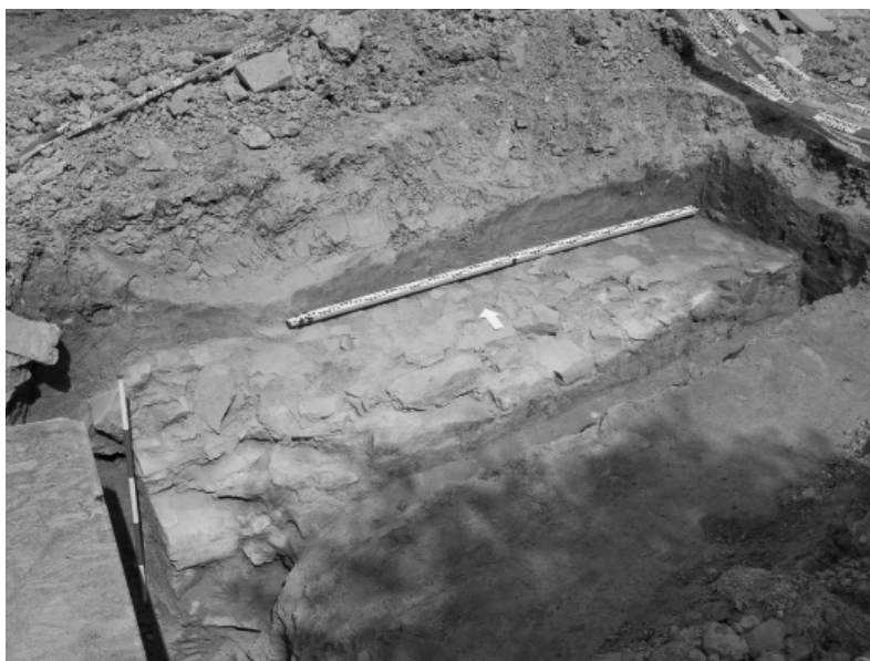
Abb. 137. Zlín (Kat. Štípa), Mariánské náměstí (Platz). Ein Anblick auf die freigelegten Grundrisse des unvollendeten Klosters.

ficky dokumentovány. Zjištěné nálezy z těchto nivních sedimentů můžeme časově zařadit do doby laténské (viz oddíl Doba železná) a doby mladohradištní. Celkem již bylo odkryto 395 zahloubených archeologických objektů. Vzhledem k rozsáhlé ploše a dalšímu trvání stavební činnosti by měl výzkum pokračovat i v roce 2013.