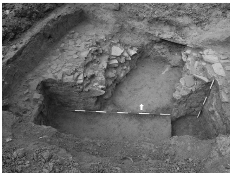
Abb. 138. Zlín (Kat. Štípa), Mariánské náměstí (Platz). Grundrisse des unvollendeten Klosters aus dem 17. Jahrhundert im Kanalisationsaushub.

Obr. 138. Zlín (k. ú. Štípa), Mariánské náměstí. Základy nedostavěného kláštera ze 17. století zachycené ve výkopu pro kanalizaci.